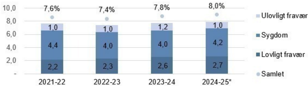
Graf. Gennemsnitligt fravær for elever i folkeskolerne i Rudersdal Kommune og fordeling på fraværskategori de seneste fire skoleår

* 2024-25 dækker over 1. august til 31. december 2024